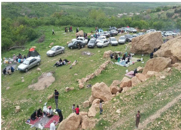
شکل ۳: نمایی از حضور گردشگران در روستای پیران

آبوهوای بسیار مطبوع به خصوص در فصل بهار همه ساله گردشگران زیادی را به خود جذب می کند (شکل ۳). وجود آبوهوای بسیار تمیز و مطبوع، باغات میوه فراوان و نیز وجود جاذبه های زیبای طبیعی همچون چشمه های متعدد و نیز آبشار موجود در این روستا فضای مناسبی را برای جذب توریسم و نیز سرمایه گذاری های گردشگری فراهم کرده است.