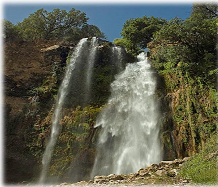
شکل ۲: نمایی زیبا از آبشار شیوند

عمده‌ترین تولیدات، صنایع دستی و سوغاتی تولیدات روستا شامل انار، گردو، بادام، گندم، برنج، گیلان و فراآورده‌های لبنی است. دوخت و تولید جاجیم، نمد، شال گردن، خورجین، گلیم و فرش‌های دستباف رایج‌ترین صنایع دستی روستای شیوند محسوب می‌شوند. ارتفاع شیوند از سطح دریا ۱۰۰۰ متر است و آب و هوای معتدل و کوهستانی دارد. سوغاتی‌های روستا ترکیبی از صنایع دستی، محصولات باغی و فراآورده‌های لبنی است. مهم‌ترین این سوغاتی‌ها عبارتند از: عسل کوهی، پنیر، کره، روغن محلی، نان شکری و نان محلی.