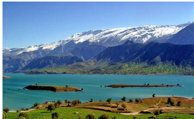
شکل شماره ۲(الف): دریاچه کارون ۳