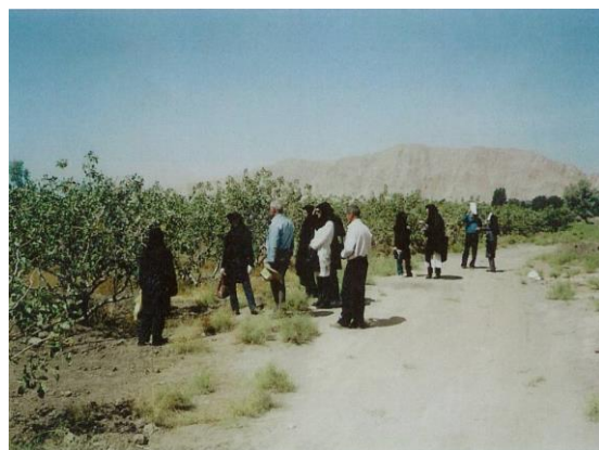
شکل ۵- بازدید کارشناسان ناظر طرح