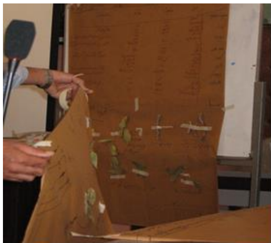
شکل ۳- شناسایی آفات گیاهی با شیوه FFS