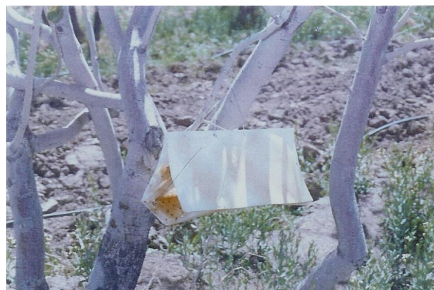
شکل ۴- مبارزه بیولوژیک با پروانه چوب‌خوار با تله فرمونی