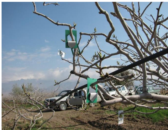
شکل ۲- به‌کارگیری کریزوکارت‌ها در مبارزه تلفیقی آفات